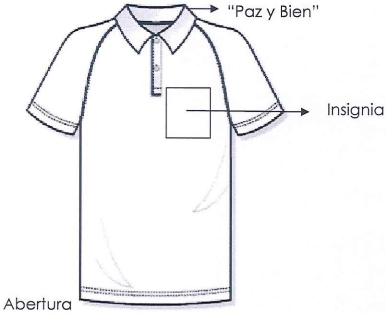
FIGURA NO. 1 (CAMISA)