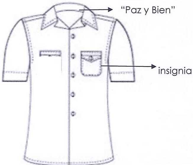
FIGURA NO. 3 (BLUSA)